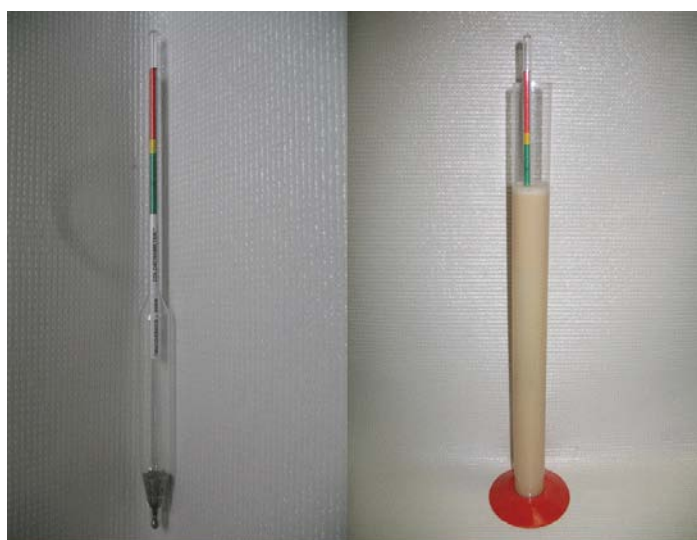
Figura 2. Calostrómetro utilizado para medir la concentración de inmunoglobulinas en el calostro.

Fleenor y Stott (1980) desarrollaron un calostrómetro o lactodensímetro, el cual incorpora la relación entre la gravedad específica del calostro y la concentración de inmunoglobulinas (mg/mL) (Figura 2). El calostrómetro está calibrado en intervalos de 5 mg/mL y lo clasifica en pobre (rojo) para concentraciones menores a 22 mg/mL, moderado (amarillo) para concentraciones entre 22 y 50 mg/mL y excelente (verde) para concentraciones mayores a 50 mg/mL.